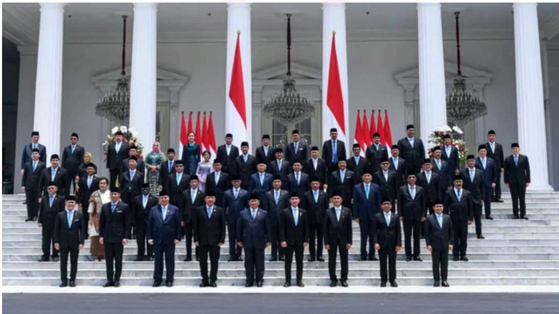
Keterangan: Kabinet Merah Putih.

Satu tahun pemerintahan Prabowo Subianto–Gibran Rakabuming Raka telah menjadi momen evaluasi penting bagi arah demokrasi, tata kelola pemerintahan, dan keadilan sosial di Indonesia. Pemerintahan ini mengambil alih kekuasaan dengan janji besar mengenai keberlanjutan pembangunan, peningkatan kesejahteraan rakyat, serta penguatan reformasi politik dan hukum sebagaimana termaktub dalam visi Asta Cita. Namun, catatan kritis dari berbagai lembaga masyarakat sipil menunjukkan bahwa perjalanan satu tahun terakhir justru memperlihatkan kemunduran signifikan dalam prinsip tata kelola yang baik, perlindungan hak asasi manusia, dan keseimbangan lingkungan hidup.