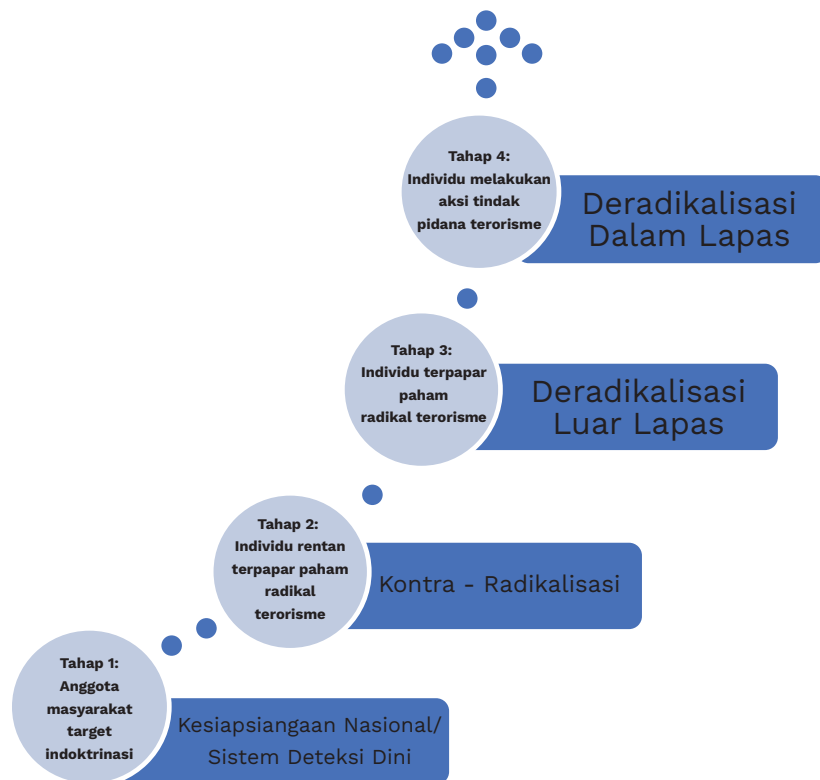
Gambar Jejak Langkah Individu menuju Pelanggaran Tindak Pidana Terorisme (UU Nomor 5 Tahun 2018)

Adapun tahapan dan bentuk intervensi sesuai Peraturan Pemerintah tersebut dalam dijabarkan dalam gambar berikut: