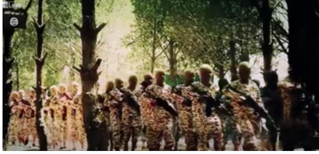
Latihan militer anak-anak di Suriah