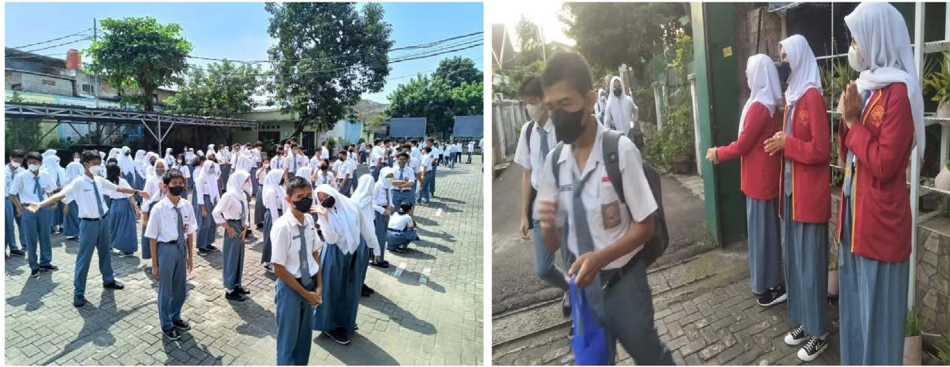
Gambar 8. Kegiatan Cahaya Cinta dan budaya 3S di SMAN 53 Jakarta

Yang keempat adalah membangun praktik demokratis dan kultur non-diskriminatif melalui organisasi kesiswaan. Hal ini terlihat dalam keragaman pemimpin organisasi kesiswaan baik secara agama dan gender. OSIS SMAN 53 Jakarta justru diketuai oleh seorang siswi. Sementara, ketua Majelis Perwakilan Kelas (MPK)-nya adalah seorang siswa yang beragama Katolik. 43 Hal ini menarik karena SMAN 53 Jakarta telah berhasil mendobrak gender stereotype tentang kepemimpinan perempuan maupun stigma terhadap minoritas agama. Bisa dikatakan, bahwa dalam konteks sekolah menengah tingkat atas ini, moderasi beragama diterapkan di dalam kegiatan P5 Kurikulum Merdeka. Meskipun secara umum, pengenalan mengenai membangun sikap moderat dalam beragama, menghargai kemajemukan, membangun toleransi, lebih banyak diintegrasikan dalam pelajaran agama maupun PPKN.