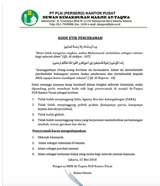
Gambar 4. Kode Etik Penceramah PLN. 17

Menurut Ustaz Al-Jupri, manager pelaksana harian peribadatan masjid PLN, kode etik yang dibuat DKM cukup membantu penceramah menyusun narasi khotbah di dalam koridor apa yang boleh dan apa yang tidak boleh. "Mereka gak boleh menyinggung masalah SARA, kelompok. Itu udah kita buat dan bingkai. Dan kita selalu infokan ke penceramah kita. Anda boleh ceramah, mengisi materi tetapi gak boleh menyinggung ini, gak boleh menyinggung politik, gak boleh menyinggung suku, agama, golongan yang lain," ujarnya. 18