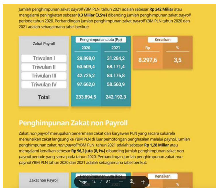
Gambar 6. Perbandingan Dana Zakat Payroll dan Non-Payroll YBM PLN Tahun 2020 dan 2021 21

Dari kedua sumber ini terlihat besarnya dana sosial yang dapat disalurkan melalui PLN. Data pada tahun 2021 menunjukkan dana yang terkumpul melalui TJSJ sebesar Rp835,83 miliar dan Rp261 Miliar di YBM PLN. 22 Ini adalah jumlah yang sangat besar, artinya dari PLN setiap tahun terkumpul dana sosial lebih dari 1 triliun rupiah. Para responden dari pimpinan PLN yang kami wawancara mengklaim bahwa ada upaya untuk mencegah penyaluran dana kepada atau melalui kelompok-kelompok radikal atau ekstrem. Menurut para pengelolanya, TJSJ dikelola cukup baik dan cenderung menghindari isu-isu sensitif, termasuk isu yang berseberangan dengan moderasi beragama. Meski tidak ada program khusus mengenai moderasi beragama, para pengelola CSR mengaku bisa menjamin bahwa penerima manfaat TJSJ bukan kelompok-kelompok ekstrem. Sayangnya, laporan detail mengenai ini tidak diberikan. Oleh karena itu, diperlukan