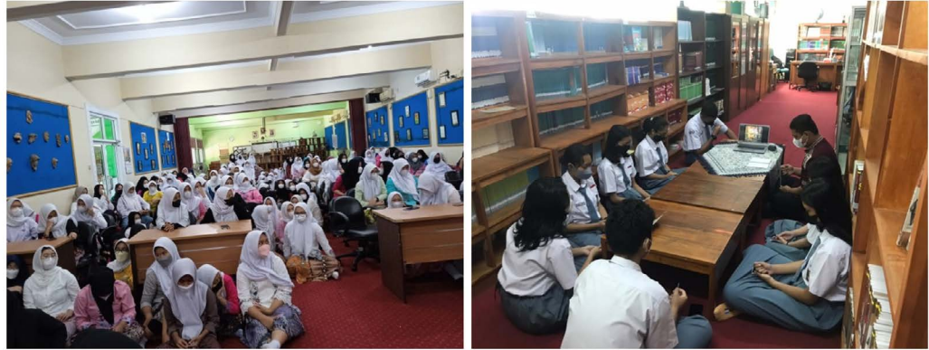
Gambar 7. Kegiatan keagamaan ROHIS (Keputrian) & ROHKAT di SMAN 53 Jakarta