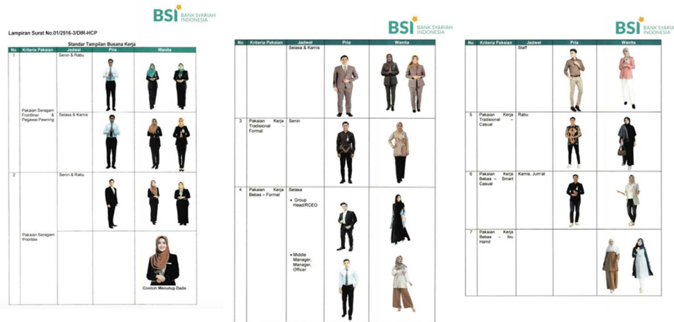
Gambar 1. Dress Code di BSI

let ini dijelaskan bahwa seragam korporat BSI dirancang dengan perpaduan konsep digital dengan pergerakan energi yang baru yang mengedepankan kesan modern, universal, keterbukaan, dan inklusif bagi seluruh stakeholder . 13